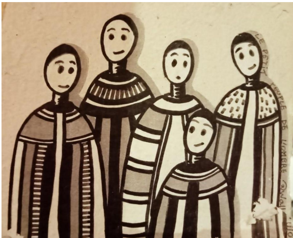
Illustration : @Wall.Lilo

Programme d'actions de prévention de la perte d'autonomie et de soutien aux aidants Septembre à décembre 2022